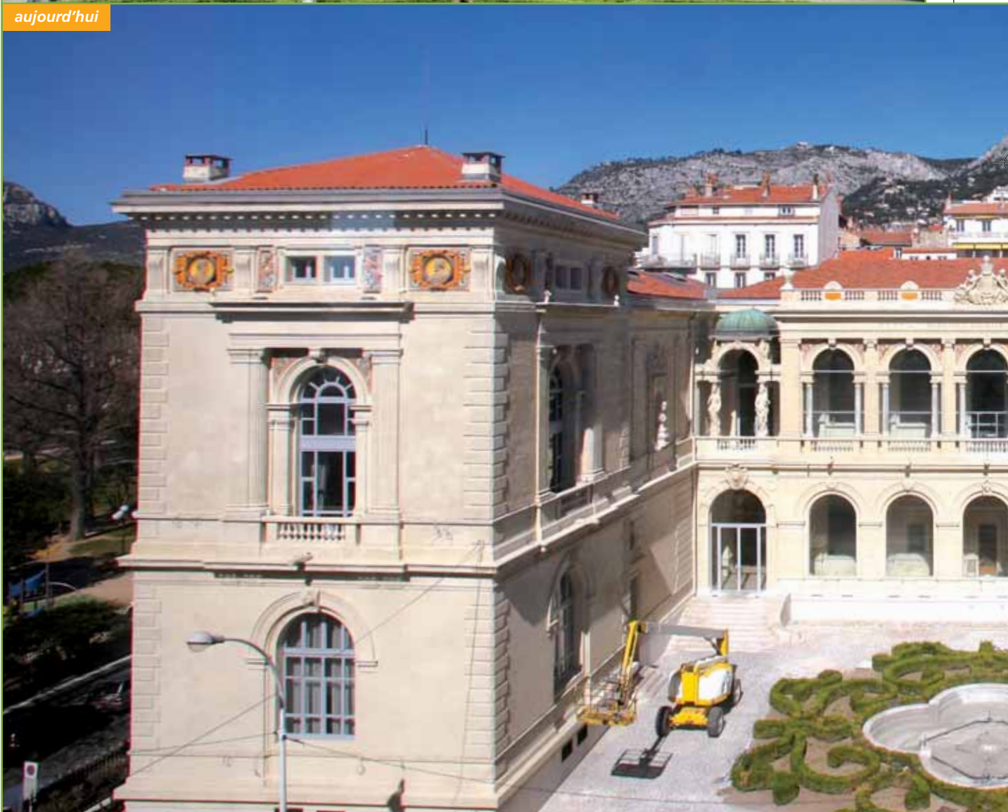
Quelques jours avant l'inauguration du Musée, les ultimes travaux ont consisté à réaménager le jardin qui agrmente la cour d'entrée