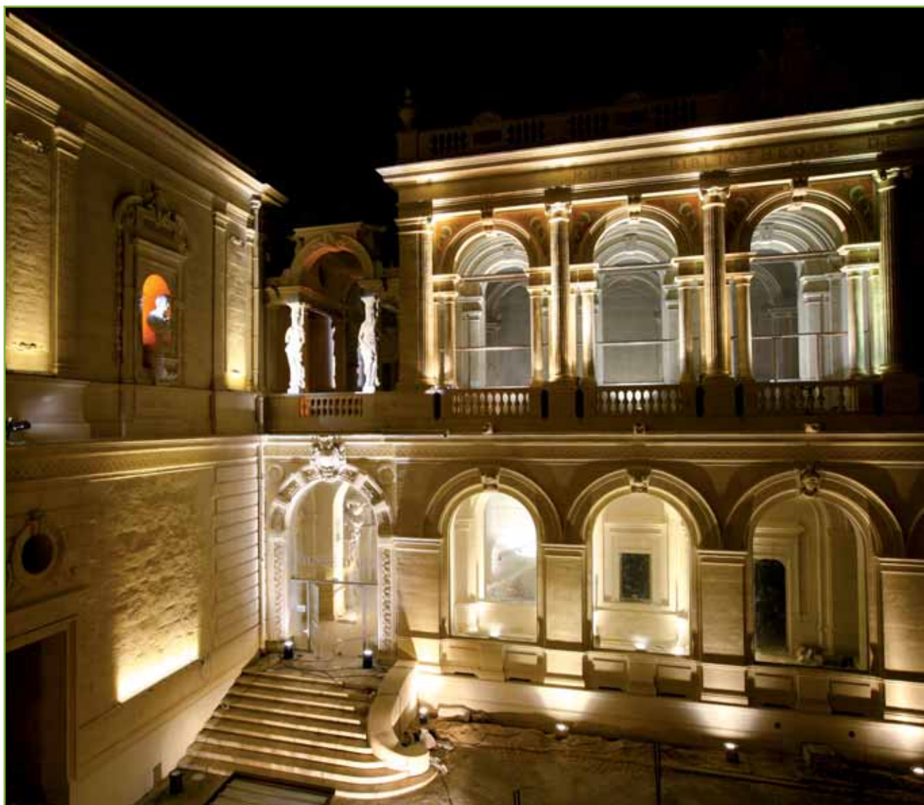
Ravalé et mis en lumière, le Musée d'Art a retrouvé toute sa splendeur.

bâtiment, âgé de 119 ans, vient de s'offrir une nouvelle jeunesse. Les façades, traitées avec soin par des spécialistes, ont retrouvé leur éclat et les détails architecturaux sont à nouveau visibles et joliment mis en valeur.