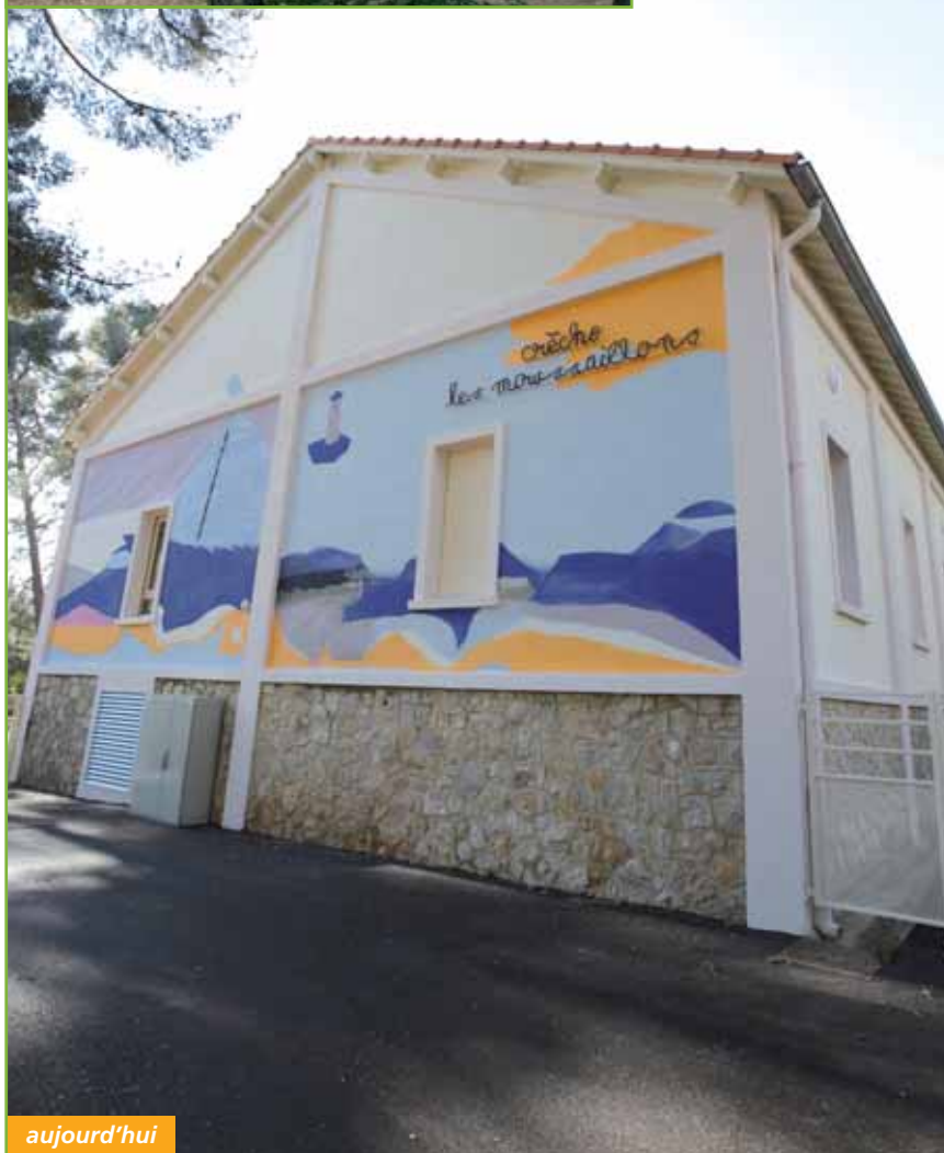
La fresque qui orne l'une des façades des "Moussaillons" a été réalisée à partir d'un dessin d'enfant.