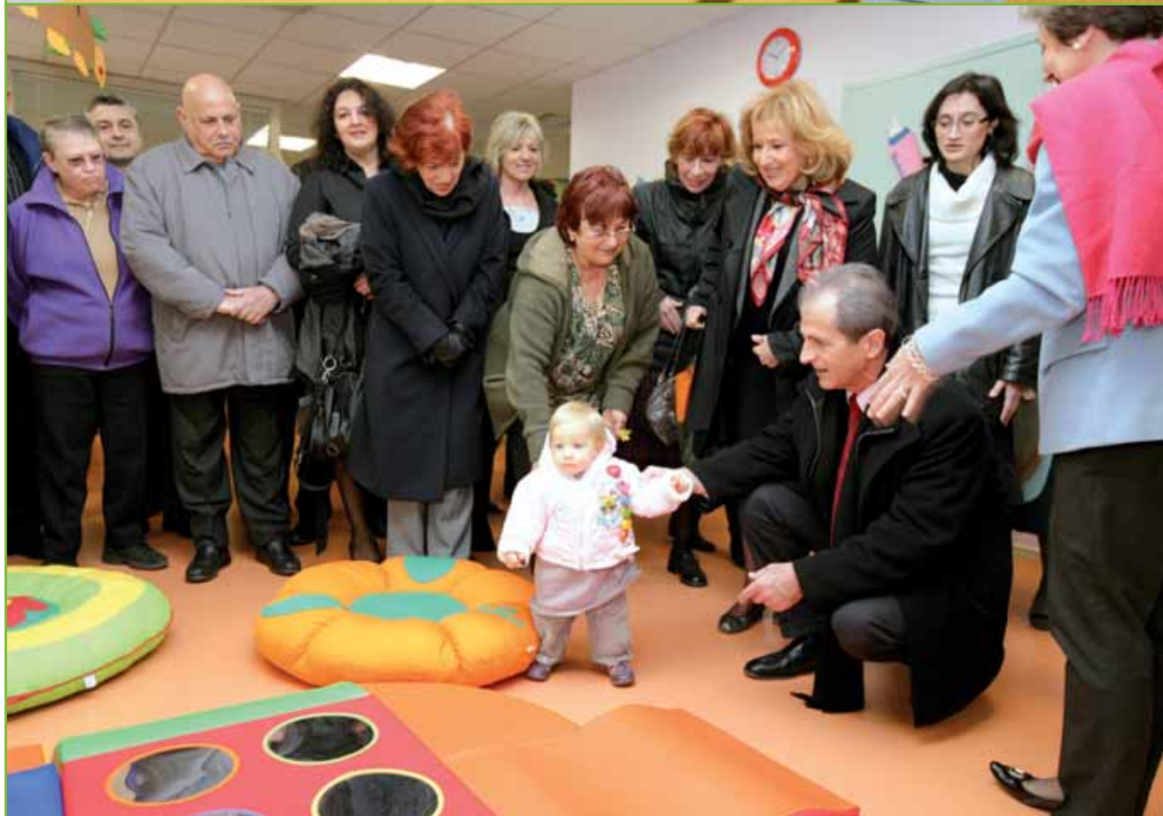
Une nouvelle structure multi-accueil qui répond aux besoins de plus de 130 familles toulonnaises.