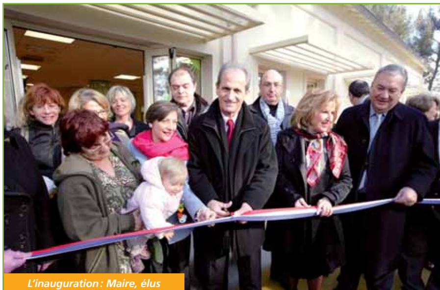
L'inauguration : Maire, élus personnel et habitants du quartier sur le pont... des Moussaillons !