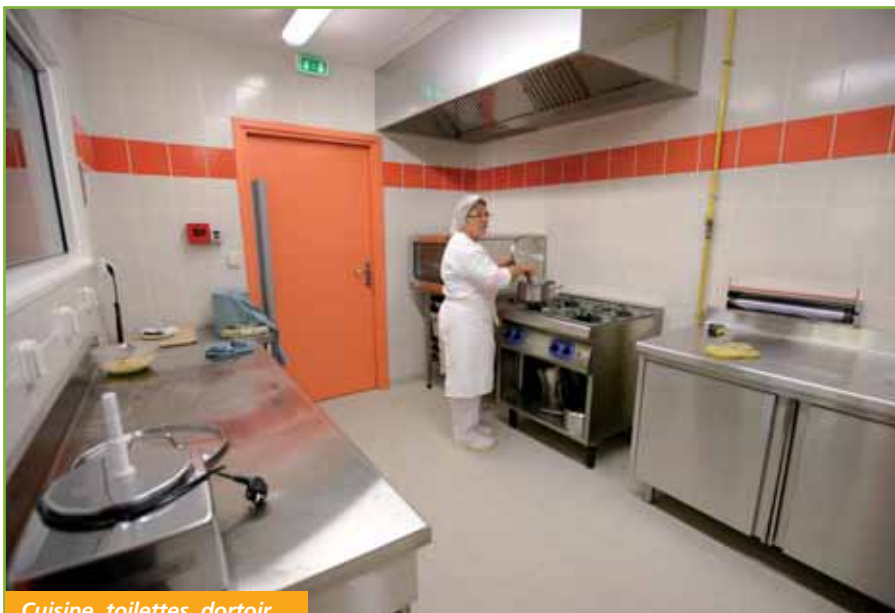
Cuisine, toilettes, dortoir...